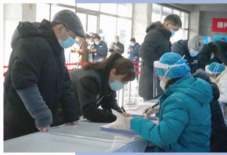
接种人员登记个人信息

首针时间 第二针时间 2月22日 3月15日 2月23日 3月16日 2月24日 3月17日 2月25日 3月18日 2月26日 3月19日 2月27日 3月20日 2月28日 3月21日 3月1日 3月22日 3月2日 3月23日 3月3日 3月24日 3月4日 3月25日 3月5日 3月26日 3月6日 3月27日 3月7日 3月28日 3月8日 3月29日 3月9日 3月30日 3月10日 3月31日 3月11日 4月1日 3月12日 4月2日 3月13日 4月3日