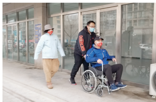
社区工作人员协助行动不便的居民前往疫苗接种点