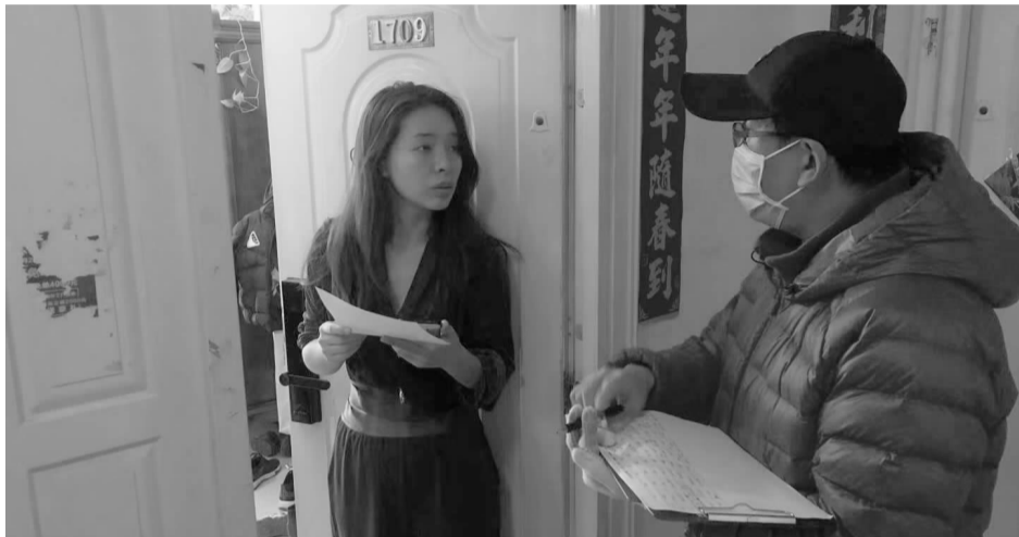
社区工作人员入户登记选民信息