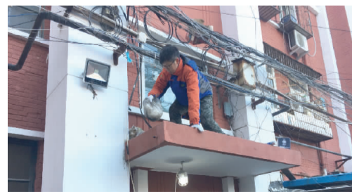
社工“登”上高处检修。