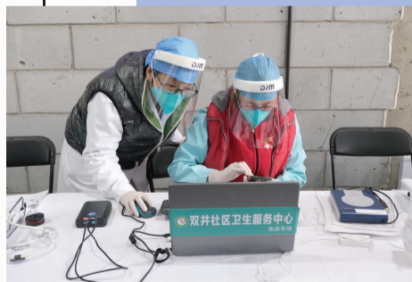
医护人员在电脑上录入信息

新冠疫苗接种工作正在双井有条不紊地开展,截至3月16日,双井已完成超26000余人第一剂次的新冠疫苗接种工作。按照两针之间相隔21天的要求,3月15日起,陆续为年后接种过第一针的居民进行第二针疫苗接种。如果您是2月22日接种的第一针,那么您的第二针接种时间应该在3月15日,以此类推。同时,第一剂次的疫苗接种仍在继续,居民可至社区预约。